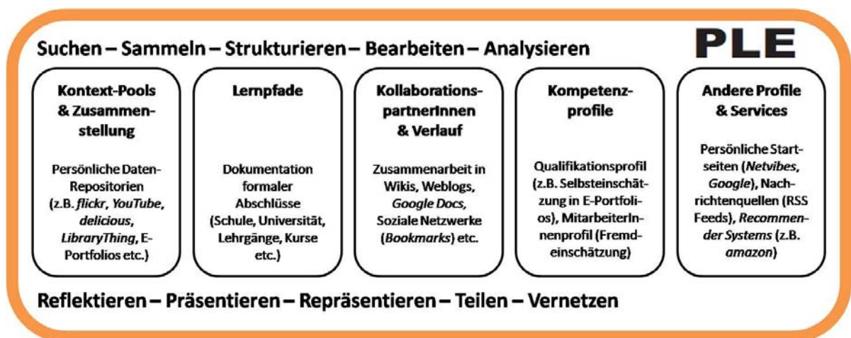
Abbildung 1: Elemente persönlicher Lernumgebungen (PLEs)

Der Zweck einer persönlichen Lernumgebung lässt sich demzufolge auf zwei grundlegende Aspekte reduzieren: Persönliches Wissensmanagement und Vernetzung . Abbildung 1 verdeutlicht abschließend die wesentlichen Elemente von PLEs.