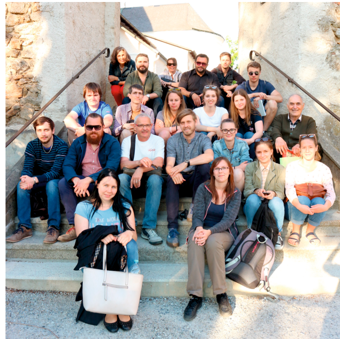
Sommerschule in Weitra. Letní škola vo Vitorazu.