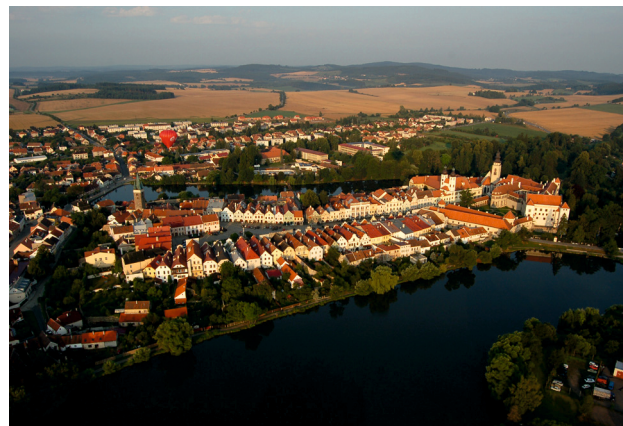
Telč in Vogelperspektive. Letecký pohled na Telč.

Územní dopad projektu v Česku zahrnuje na úrovni místní Brno, Telč (a okolí), Nové Hradce (a okolí) a na regionální úrovni kraje Jihomoravský, Vysočina, Jihočeský. Na národní úrovni poskytne projekt ústředním orgánům k dispozici publikace, přednášky expertů na projektových akcích (např. MMR ČR, Evropská územní spolupráce). Dotčené území bude těžit z projektu díky nově získaným, originálním poznatkům z terénu, především z vlastního šetření. Zdejší regionální rozvoj se zaměřením na společné kulturní dědictví má přirozeně také národní rozměr a může sloužit jako modelový pro jiné hraniční regiony Evropy. Snahou je mj. vzbudit u studentů zájem o dění v tomto specifickém regionu z hlediska přeshraničního regionálního rozvoje.