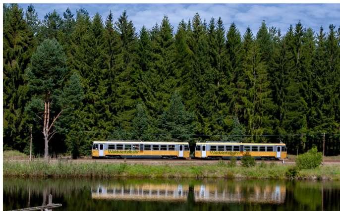
Waldviertlerbahn. Železnica ve Waldviertlu.

Der Wirkungsbereich in Österreich mit den Brennpunkten der Aktivitäten in Weitra, Retz und Krems erstreckt sich regional über das ganze Wald- und Weinviertel und auch Teile des Mühlviertels. Vertreter aller Verwaltungsebenen werden durch deren Einladung zur Verfolgung der Projektaktivitäten sowie durch Übergabe der Buchpublikation zum Projekt erreicht. Entwicklung der Region ist auch von nationaler Relevanz und kann modellhaft für andere Grenzregionen in Europa dienen, die über gemeinsames Kulturerbe verfügen.