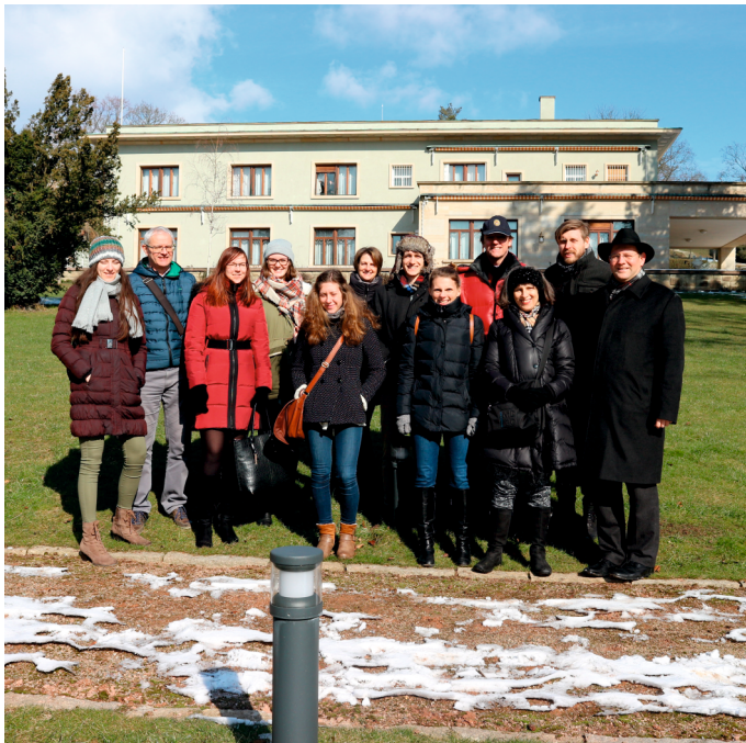
Kick-off Exkursion in Brno. Kick-off exkurze Brno.