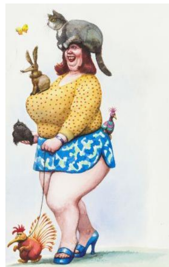
Manfred Deix, Sommerzeit – Zeit der Miss-Wahlen: Miss Tierliebe, 2002, Landessammlungen Niederösterreich

Ab 2017 präsentiert sich die neu gestaltete Manfred Deix Ausstellung IMMER WIEDER DEIX! mit aufwendig aquarellierten Cartoon Klassikern aus den Landessammlungen Niederösterreich. Die Schau blickt zurück auf das außergewöhnliche Schaffen des „enfant terrible“ der deutschsprachigen Karikaturszene. Manfred Deix wurde für seine drastisch gemalten Zeitkommentare beim Publikum als österreichischer Volkskünstler verehrt aber auch angefeindet. Seine Bilder gewähren Einblicke in die Abgründe unseres Alltags und verleihen der österreichischen Seele Ausdruck. IMMER WIEDER DEIX! präsentiert einen bunten Reigen seiner wunderbaren „Deixfiguren“, abgerundet mit unveröffentlichtem Material und private Aufzeichnungen des Künstlers bieten einen unvergesslichen Besuch im einzigen Museum für Karikatur und Satire.