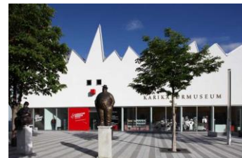
Karikaturmuseum Krems (Architekt: Gustav Peichl)

Das Karikaturmuseum Krems - Österreichs einziges Museum für Karikatur, Bildsatire, Comic und Cartoon – liegt nur 5 Gehminuten von der Schiffsanlegestelle Krems – Stein entfernt und lockt jährlich tausende Besucher in die Wachau. Nach Sanierungsarbeiten, beginnend Anfang 2017 startet das Museum Mitte Mai 2017 mit tollen Highlights und neuen Ausstellungsräumen wieder voll durch!