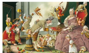
Bruno Haberzettl, Das Kaiserpaar Maria Theresia und Franz I. im Kreise ihrer Kinder. Die Einführung der Schulpflicht war nur eine Frage der Zeit..., 2009 © Bruno Haberzettl, 2017

Pünktlich zu Schulbeginn müssen über 20 Zeichnerinnen und Zeichner nachsitzen. Sie widmen sich den brennenden Themen, wie Schülern und Lehrern, Bildungspolitik, Schulmodelle, Reformen und den Vorstellungen einer zukünftigen, modernen Schule. Dabei zeigt sich eines klar: Mit Humor lebt und lernt es sich viel leichter.