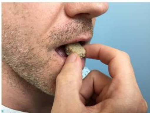
Fig. 12. Deglutição com pão mole (1.5x1.5cm) - Subteste "Sólido"