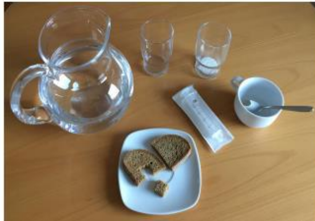
Fig. 1 Utensílios para o GUSS-UCI