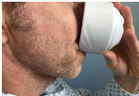
Fig. 8 Deglutição de 3ml de água por uma chávena