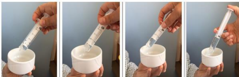
Fig. 9 Teste de Deglutição da água com aumento dos volumes (3,5,10,20ml)