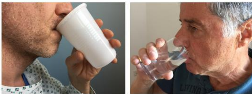
Fig. 10 deglutição de 50ml de água por copo