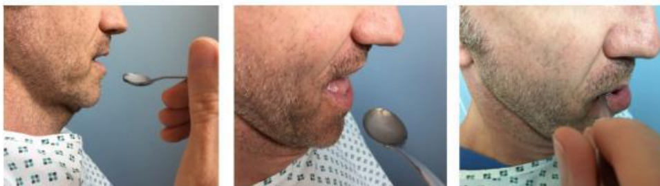
Fig. 6 Administração de uma colher de chá de água espessada