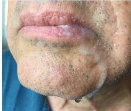
Fig.2 Escape anterior (saliva)