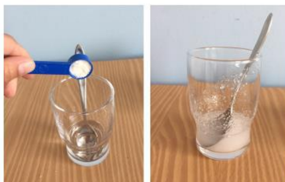
Fig. 5 Espessar a água para a análise da deglutição de líquido moderadamente espesso

( https://iddsi.org/IDDSI/media/images/Translations/IDDS_Testing_Methods_V2_Portuguese_Portugal_Final_Dec_2020.pdf ) (Chichero et al. 2017)