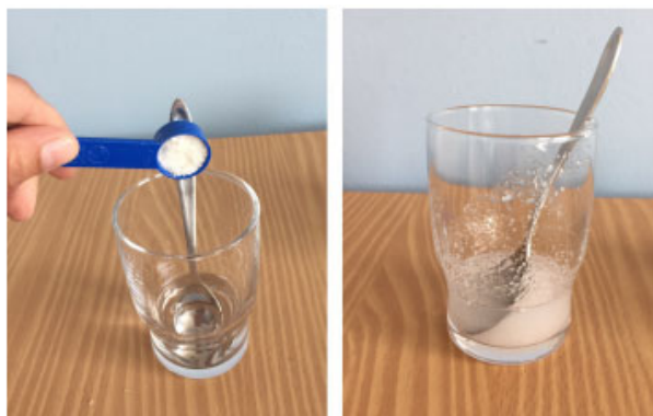
Abb. 5 Andicken von Wasser für den Breischluckversuch