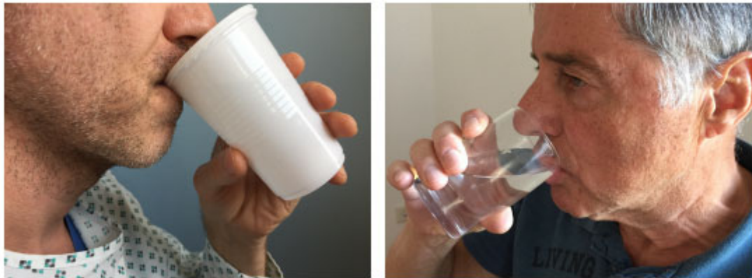
Abb. 10 Trinken von 50ml aus dem Becher oder Glas