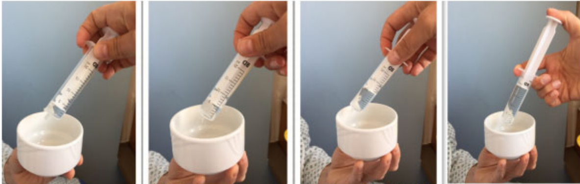
Abb. 9 Wassertest in aufsteigender Menge (3,5,10,20ml)