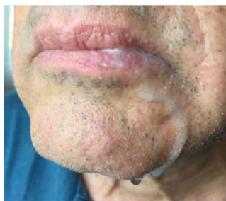
Abb. 2 Speicheldrooling