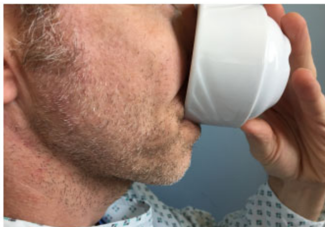
Abb. 8 Trinken von 3ml Wasser aus der Tasse