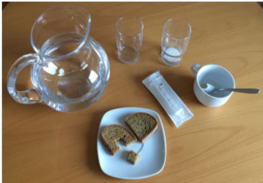
Abb. 1 Utensilien für den GUSS