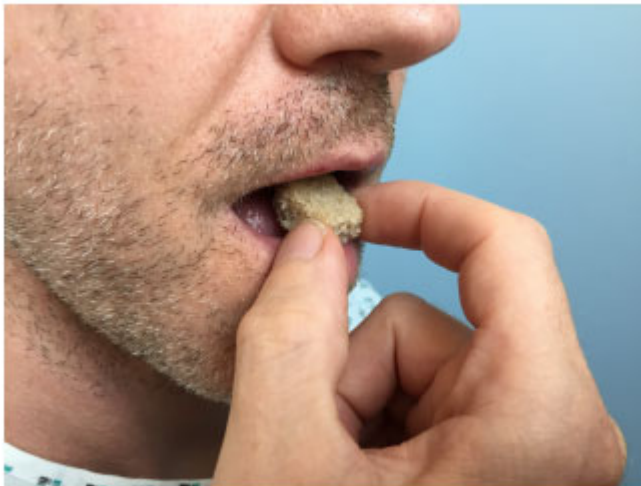
Abb. 12 Schluckversuch mit Brot (1,5x1,5cm) Subtest "FEST"