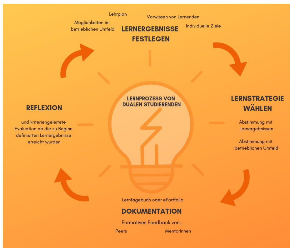
Abbildung 1: Typische Tätigkeiten von MentorInnen und dualen Studierenden in einer Lernphase. Das Modell ist angelehnt an das ATS2020 Lernmodell zur Förderung von fächerübergreifenden Fähigkeiten durch ePortfolio-Arbeit (Ghoneim, Gruber-Mücke, & Grundschober, 2017).

Das duale Studium ist durch mehrere Lernphasen (etwa Semester, Module, Lehrveranstaltungen) strukturiert. Im folgenden Abschnitt werden typische Tätigkeiten von MentorInnen und dualen Studierenden in einer Lernphase beschrieben.