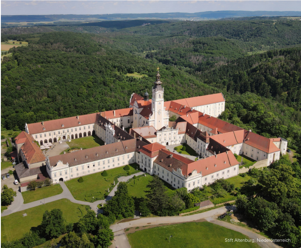
Stift Altenburg, Niederösterreich