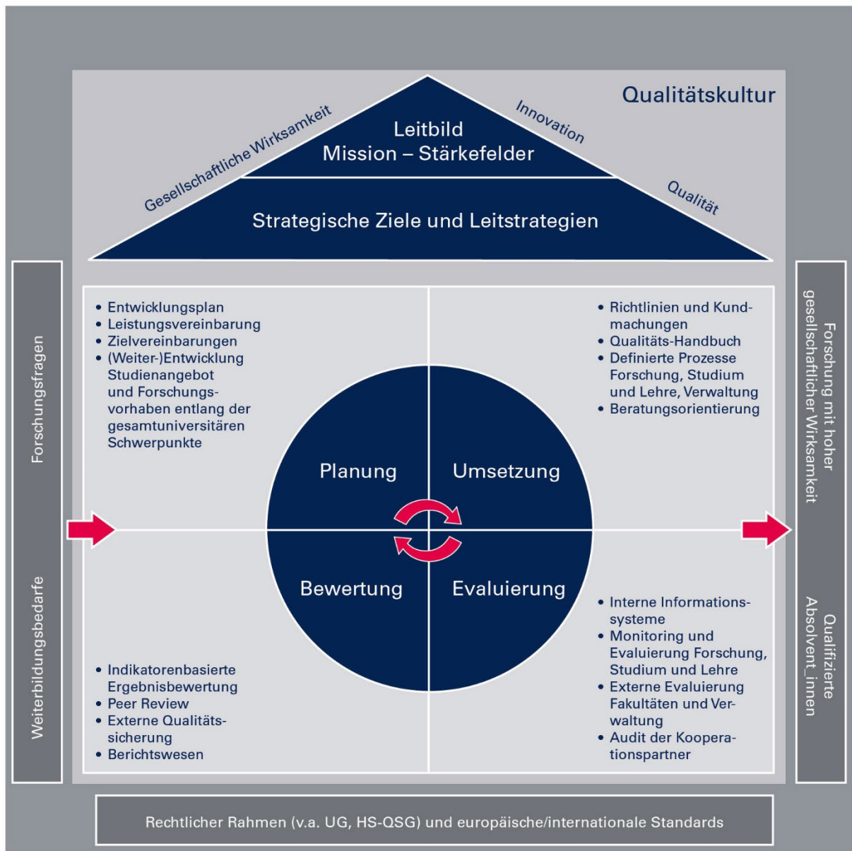
Abbildung 1: Qualitätskultur der Universität für Weiterbildung Krems